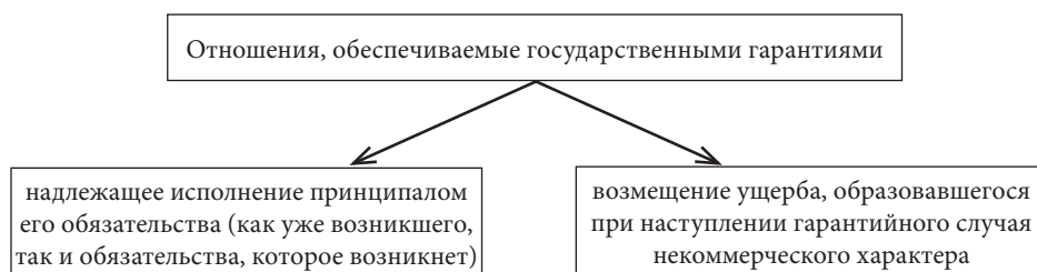
Рис. 1. Отношения, обеспечиваемые государственными гарантиями

Согласно ст. 115–117 Бюджетного кодекса Российской Федерации [1] государственные гарантии могут обеспечивать (рис. 1).