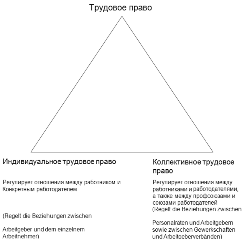
Рис. 3. Особенности трудового права Германии

ленности членов в профсоюзах, а также интереса работодателей к коллективным договорам. За 30 лет профсоюзы потеряли 50 % своих членов, а более половины оставшихся членов сейчас уже вышли на пенсию. Менее 10 % работающих немцев на сегодняшний день по-прежнему являются членами профсоюза. Эта ситуация действует по принципу сообщающихся сосудов: когда профсоюзы теряют свою важность, возрастает популярность производственных советов (Betriebsrat).