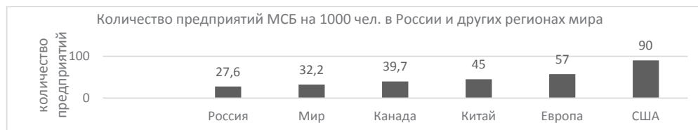
Рис. 1 / Fig. 1. Количество предприятий МСП на 1000 чел. в России и других регионах мира / Number of SMEs per 1000 pers. in Russia and other regions of the world